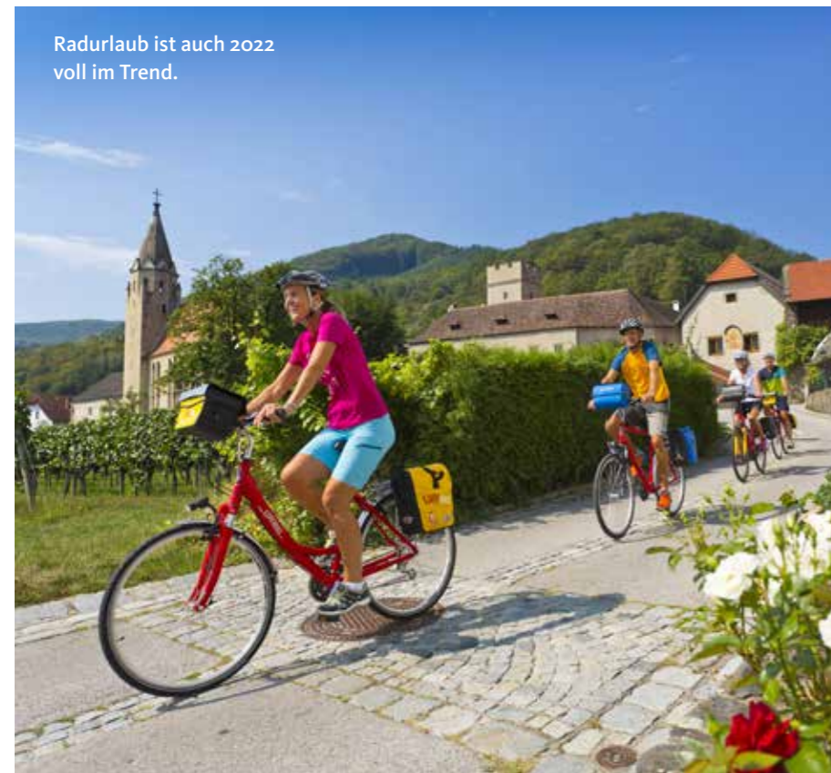
Radurlaub ist auch 2022 voll im Trend.

Alles, was interessant für eine Radreise ist.